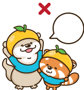
話し言葉については、原則として市の監修が必要