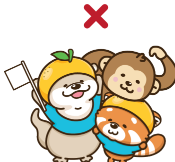
画や他のイラストと組み合わせない