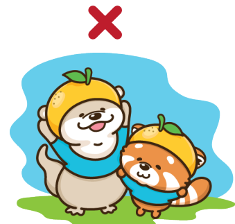
背景画(イラスト)にいっちとかっちを組み合わせる場合は、市のデザインの監修が必要