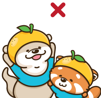
トリミングしない