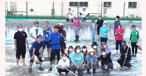
【子供たちのために集まった地域の方々】

6月9日(木)大洲小学校でプール清掃が行われました。プール清掃について学校から人手が足りなく困っているという意見を受けて、地域学校協働活動推進員からプール清掃ボランティアを呼びかけました。当日は、保護者(11名)、地域の方(4名)が集まり大洲小のプールをきれいにしてくれました。地域学校協働本部では、幅広い地域住民等の協力を得て、地域全体で子供たちの学びや成長を支えるとともに、「学校を核とした地域づくり」を目指します。