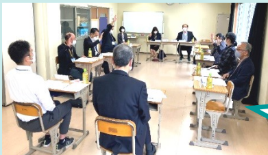
【第四中での協議会の様子】

市内すべての幼・小・中・義務教育学校・特別支援学校61校・園にて、今年度の第1回学校運営協議会が開催されました。主な協議内容は、「令和4年度学校・幼稚園運営についての基本方針の承認及び意見」でした。校長・園長先生から学校・幼稚園運営についての説明があり、それに対して委員の方々からたくさんの貴重な意見があげられました。第2回以降も子供たちの成長につながる意見が集まる場となることを期待されます。