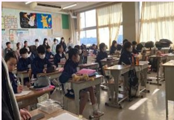
6年生による高谷中学校授業見学の様子

小学校同士の交流活動では、わが町・未来探究科で「地域の環境」についての学習をまとめたリーフレットを、オンラインで発表し合う活動等を行いました。