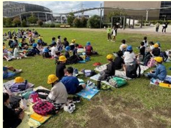
曾谷小学校・稲越小学校の合同校外学習の様子

ふるさと探究科の取り組みとして、小学校では、地域の課題等とSDGsを関連させた学習を通して、中学校は、キャリア教育や校外学習等の際に10代向けの映像教材などを活用した学習を通して、「探究的な学習」に取り組んでいます。