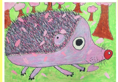
市川市立若宮小学校 特別支援学級児童作品