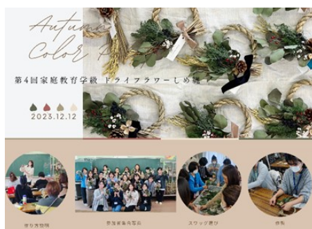
行徳小学校でのドライフラワーづくりの講座の様子

「みんな同じことで悩んでいると思い、気が楽になった。」 「話を聞いてもらえて良かった。」 「ネットで何でも調べられるけど、実際に生で聞く情報は頭にも心にも残るので、参加して良かった。」これらは、今年度の家庭教育学級に参加された方々からの感想の一部です。 『家庭教育学級』は、講師の話を一方向的に聴くだけでなく、参加者同士で子育ての不安や悩みを共有したり、情報を交換したりすることが魅力の一つです。 コロナ禍によるICTの浸透により様々な面でデジタル化が進み、便利になる一方で、人間関係の希薄化が叫ばれている現代において、『家庭教育学級』では、次年度も「人と人とのつながり」に重点を置きながら活動を進めてまいります。 【学校地域連携推進課】