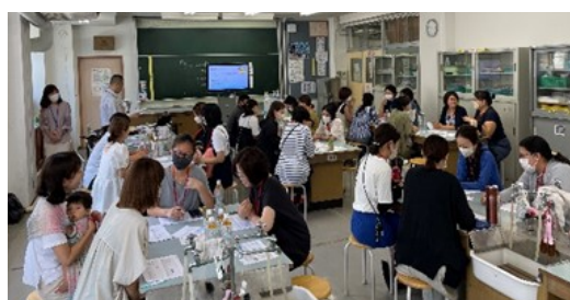
富貴島小学校での講座の様子

『家庭教育学級』に気軽に参加し、学び合い、つながりましょう。 子どもたちを「みんな」で育てていきましょう。 すべては子どもたちのために。