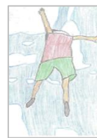
Rです! さん (五中)