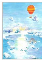
Rabbit girl さん (南行徳中)