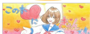
おにぎり さん (塩浜学園)