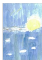
ゆき犬 さん (塩浜学園)