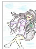
かたきはとった^^TM さん (五中)